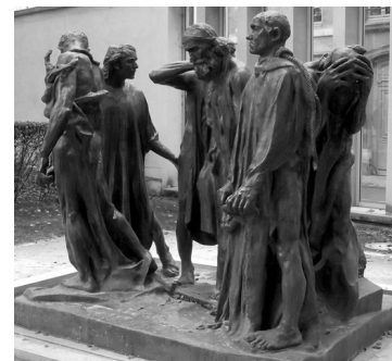
"Réforme des retraites : fonctionnaires allant, la corde au cou, implorer leur grâce."

Elle met en évidence que, pour les fonctionnaires, la perspective d'un régime universel fondé sur une moyenne de carrière révèle les inégalités qui frappent les actifs et met au jour la nécessité de repenser la notion de carrière.